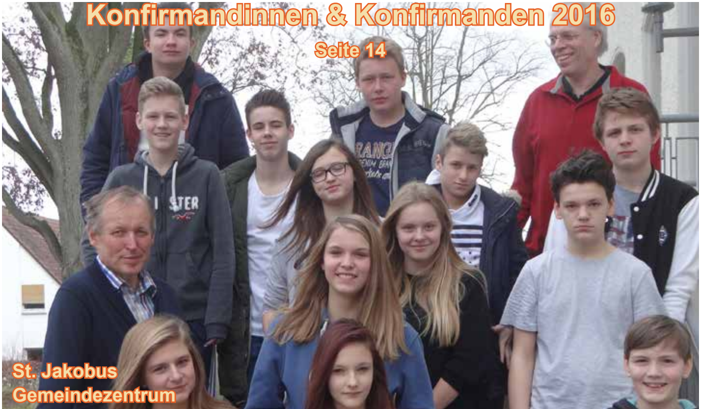
St. Jakobus Gemeindezentrum