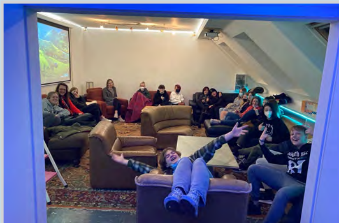
Blick in die renovierte Teestube

Hallo, ich bin es, die alte Teestube!!! Habt Ihr mich nicht erkannt? Das glaube ich!!! Bei mir hat sich auch einiges verändert. Ich bin der neue Jugendraum. Ich hatte mir so überlegt, nach Jahrzehnten wird es mal wieder Zeit für eine Veränderung. Deswegen hatte ich mich mal mit den Jugendlichen unterhalten, welche Veränderungen sie gerne hätten. Die Vorschläge fand ich mega und deswegen haben sich die Jugendmitarbeiter Gedanken gemacht und diese dann Anfang Dezember umgesetzt.