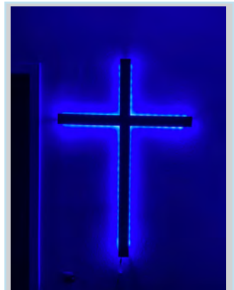
Das neue Kreuz

Ich bin sowas von zufrieden mit dem Ergebnis und ich glaube die Konfis und die Jugendlichen sind es auch. Ich höre jeden Samstag beim Jugendkreis wie schön ich geworden bin!!! :-)