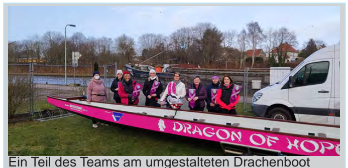
Ein Teil des Teams am umgestalteten Drachenboot

Es gibt das Symbol der pinken Schleife, diese steht für Brustkrebs. Wir sind also alle Paddlerinnen, die irgendwann einmal an Brustkrebs erkrankt waren oder noch sind. In diesem tollen Team unterstützen wir uns gegenseitig, sitzen eben in einem Boot, um mit der positiven Power im Team dem Brustkrebs davon zu paddeln. Denn diese Bewegungsphysiologie wirkt sich äußerst gesundheitsfördernd auf die Betroffenen aus.