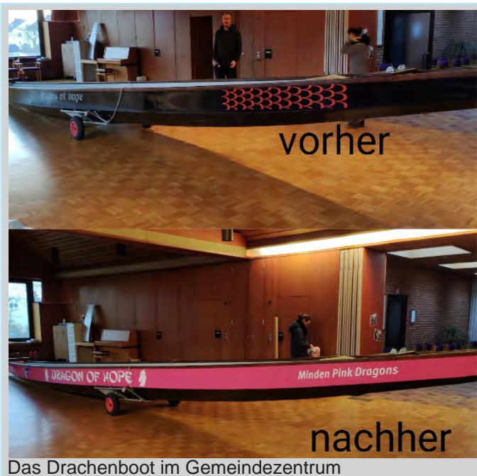
Das Drachenboot im Gemeindezentrum

Was war denn das? Einige Gemeindemitglieder haben es gesehen und sich gefragt, was das sollte. Mitte November stand plötzlich für 24 Stunden ein sehr langes Boot im Gemeindezentrum St. Jakobus. Ein sogenanntes Drachenboot. Ich will euch erklären warum.