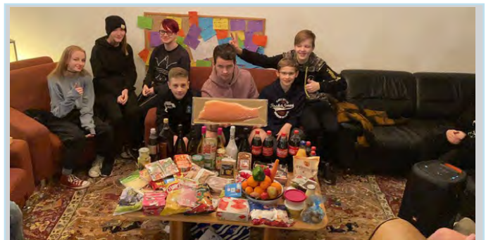
Die Zutaten für das gemeinsame Raclette

1,0 kg Lachs war das Highlight... herzlichen Dank an die freundlichen Spender ;-)! Anschließend feierten wir gemeinsam ins neue Jahr rein. Dann war die Freizeit auch leider schon zu Ende.