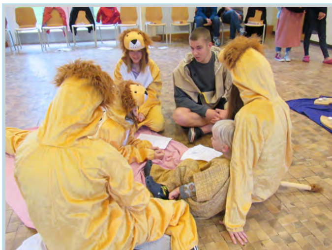
Die Löwen in der Grube - Anspiel in der Themeneinheit

So lautete das Thema unserer Gemeindefreizeit 2021. Natürlich haben wir nicht in der Wildnis oder bei gefährlichen Tieren gehaust, sondern wieder an der schönen Ostsee in Zinnowitz, in der St.Otto-Familien- und Begegnungsstätte mit Vollpension und Rund-um-Service.