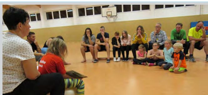
Gemeinsamer Abendimpuls nach dem Sport

Schön war es... wirklich! Eine Woche Ferien mit Freunden und Bekannten an der Ostsee...cool!