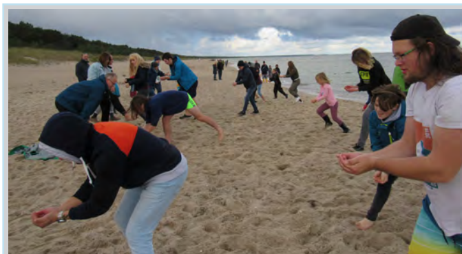
Gemeinsamer Spaß bei der Strand-Olympiade

Dankbar blicken wir zurück: alle Teilnehmer sind heile und gesund hin und auch wieder zurück nach Hause gekommen. Dankbar für eine intensive Zeit von Gesprächen und Austausch, ein tolles Miteinander besonders zwischen den Kindern und Jugendlichen. Dankbar für alle Gedanken, die wir miteinander teilen konnten. Dankbar für die Zeit, die wir dort erleben und genießen konnten.