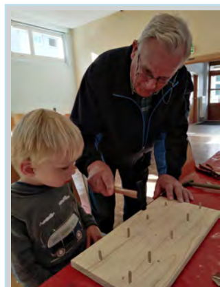
Jung & Alt kreativ

Hallo, es war mal wieder Super... Damit wäre alles gesagt, aber für die die nicht dabei waren, wollen wir hier einen kleinen Einblick in die Gemeindefreizeit geben.