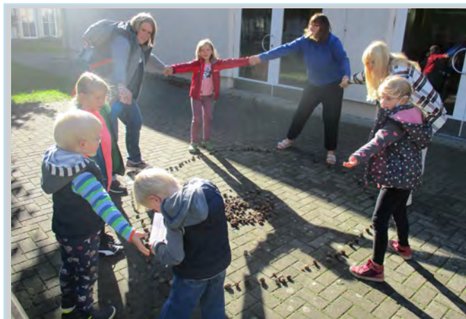
Themenarbeit in altersgerechten Gruppen

ches Beisammensein ließen diesen ausklingen. Am Ende der Woche gab es wieder den bunten Abend und jeder der wollte, konnte diesen mit seinem Beitrag bereichern.