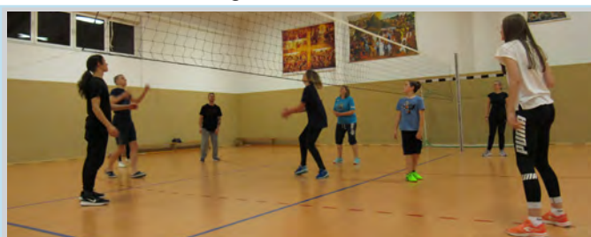
Volleyball in der Halle

An verschiedenen Abenden gab es Kinderturnen und Volleyball, da ist jeder auf seine Kosten gekommen. Und es gab jede Menge lustige Dinge, die in dieser Woche passiert sind. Am Donnerstag war das Volleyball- und Fußballturnier. Leider hat Holland gewonnen, aber Italien hat sich als guter Verlierer gezeigt. Freitag gab es einen Bunten Abend und viele haben dazu beigetragen, dass es ein erlebnisreicher und witziger Abend wurde.