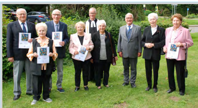
Gnaden-Konfirmandinnen & -Konfirmanden