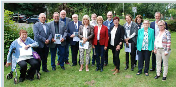
Gold-Konfirmandinnen & -Konfirmanden Wichernhaus