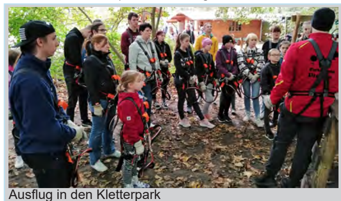
Ausflug in den Kletterpark

Die Kinder hatten ein riesengroßes Freiluftareal zum Spielen. Man konnte sie ohne Sorgen auf dem gesicherten Gelände losziehen lassen. Es war einfach vieles da für die Kids. Für schlechtes Wetter konnte man auch die Kegelbahn nutzen. Die Spaziergänge am schönen Ostseestrand waren einfach eine pure Erholung.