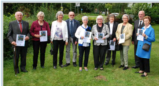
Eiserne Konfirmandinnen & Konfirmanden