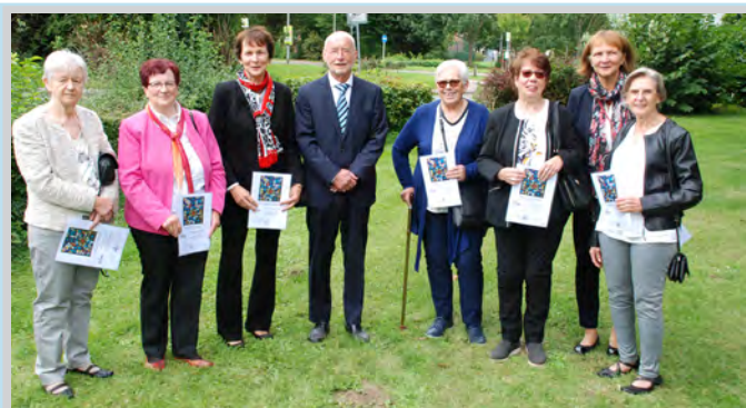
Diamant-Konfirmandinnen & -Konfirmanden