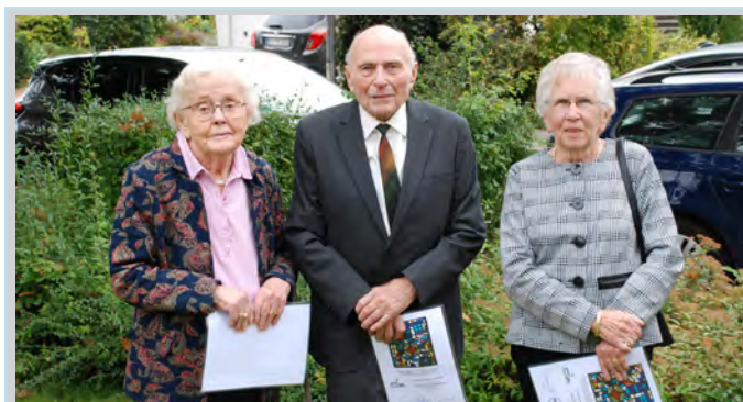
Kronjuwelen-Konfirmandinnen & -Konfirmand