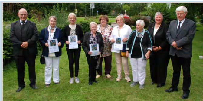
Gold-Konfirmandinnen & -Konfirmanden St. Jakobus