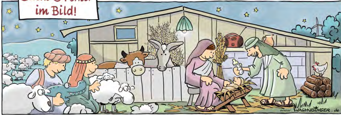
Krokodil, Lampe, Windrad, Babyflasche, Windrad