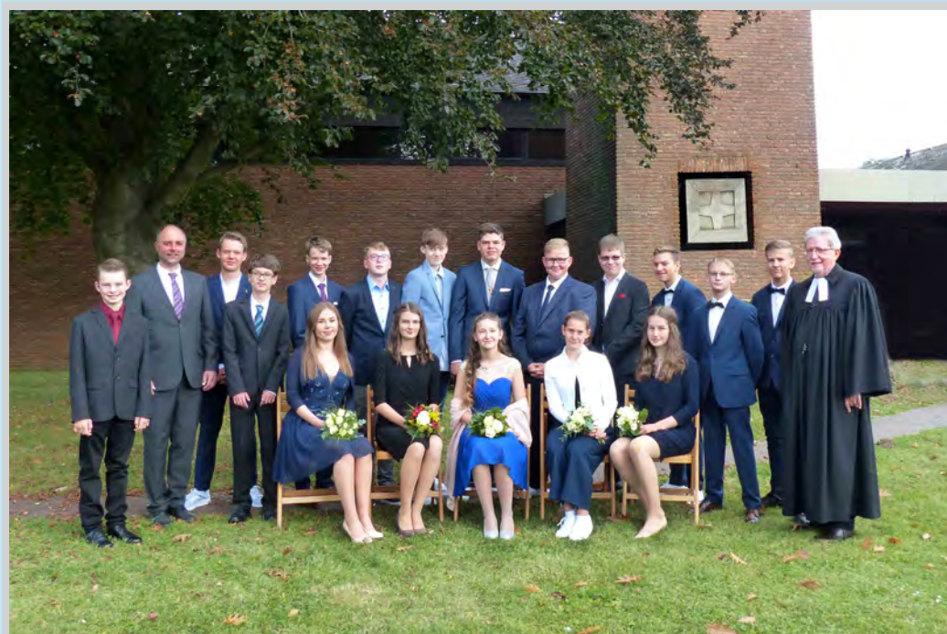
Die Konfirmandinnen und Konfirmanden der St. Jakobus-Gruppe