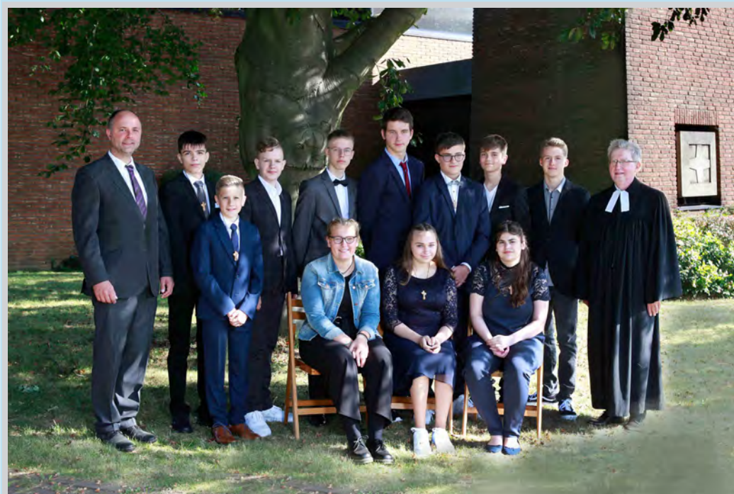
Die Konfirmandinnen und Konfirmanden der Wichernhaus-Gruppe