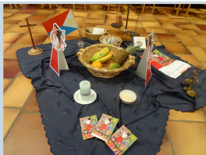
Rückblick auf den Weltgebetstag am 03. März 2017

Unter Leitung der neuen Teams fand am 03. März im Gemeindezentrum der Weltgebetstag statt. Er wurde zusammen mit der Frauenhilfe Barkhausen und Interessierten aus beiden Gemeinden gefeiert.