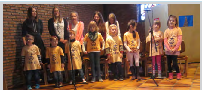
Der „Chor der Kinderbibelwoche“ beim Oster-Musical am Ostersonntag in der St. Jakobus-Kirche.