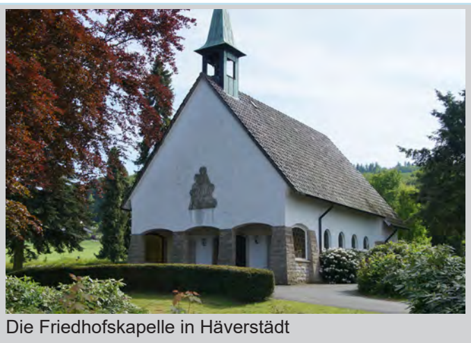
Die Friedhofskapelle in Häverstädt