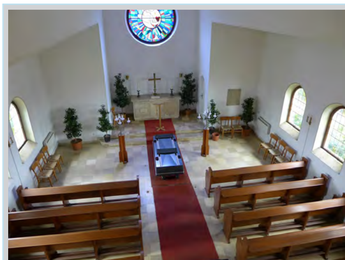
Blick in die Friedhofskapelle in Häverstädt

Die Finanzierung erfolgt durch die Nutzungsentgelte der Kapelle, durch Spenden und durch die Beiträge der Mitglieder des Vereins.