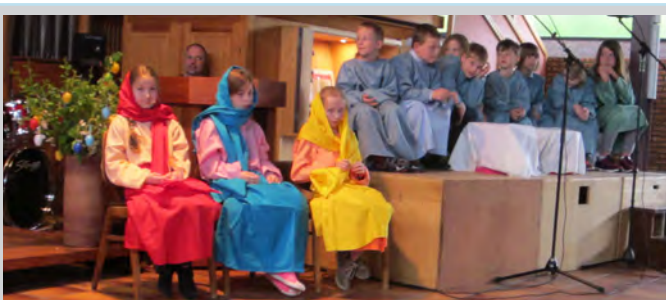
Rückblick auf das Oster-Musical am Ostersonntag in der St. Jakobus-Kirche.