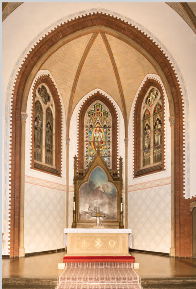
Der Altarraum der Kirche in Barkhausen

Schon seit Jahren ist es Tradition, dass die Nachbarschaft der St. Jakobus-Kirchengemeinde und der Kirchengemeinde Barkhausen den Reformationstag gemeinsam in der Barkhauser Kirche und im Martin-Luther-Haus feiert. Das wollen wir in diesem Jahr, wenn der Reformationstag zum 500jährigen Jubiläum offizieller bundesweiter Feiertag ist, in besonderer Weise tun.