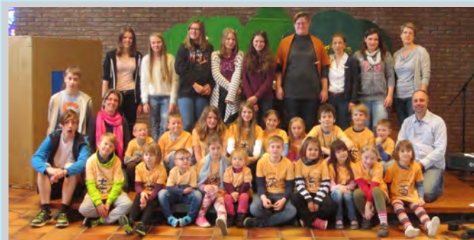
Die Kinder und ein Teil der MitarbeiterInnen der KiBiWo

Diese fand in der (Kar-)Woche vor Ostern statt und um Ostern drehte sich auch alles: von der Geschichte bis hin zu den Bastelarbeiten. Jeden Tag begaben sich die Kinder ein Stück weiter mit den Jüngern, auf dem Weg Jesu nach Jerusalem, hin zum Abendmahl, zum Kreuz und zum Grab. Und auf den Weg nach Emmaus, auf dem die Jünger noch auf alt hergebrachte Art, der mündlichen Überlieferung, von der Osterbotschaft überrascht wurden. Ihre Trauer verwandelte sich in Freude, als sie erfuhren, dass Jesus Christus lebt. Dieses Erlebnis wurde auch im Familiengottesdienst am Ostersonntag spürbar. Mit etwas technischen Schwierigkeiten, aber vollem Einsatz, wirksamen Kulissen und Kostümen erzählten und sangen die Darsteller die Geschichte.