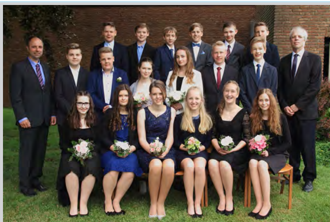
Die Konfirmandinnen und Konfirmanden bei ihrer Konfirmation am 04.06.2017

Ihr seid hier weiter gern gesehen und herzlich willkommen!