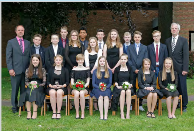
Die Konfirmandinnen und Konfirmanden bei ihrer Konfirmation am 28.05.2017

Es war eine kurze, aber erlebnisreiche Zeit, seit September letzten Jahres. In der Reflexion staunten die Konfis selbst darüber, lobten die spaßige und lockere Unterrichts Atmosphäre und erinnerten sich gern an die Freizeit am Dümmer See, das gemeinsame Kochen und Spielen und die Übernachtung im Wichernhaus nach dem letzten KU-Samstag. Auch die Gottesdienstbesuche wurden von einigen über das Maß hinaus wahrgenommen und selbst das Unterrichtsgespräch – einige würden es Prüfung nennen – wurde von allen Konfis gemeistert.