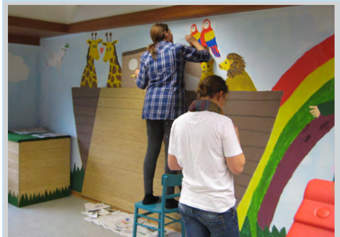
Eltern bei der Neugestaltung des Wandbildes

Viele Hände machen der Arbeit ein schnelles Ende... so kennt man das Sprichwort, worin sich effektives Arbeiten und kollegiale Gemeinschaft vereinen. Wenn dazu noch Freude und Kreativität kommen, ist dies sogar für Unbeteiligte sichtbar.